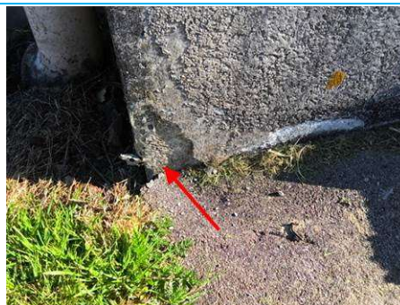
Matériaux : ZPSO-002 Prélèvement : P002 Description : Enduit extérieur soubassement Localisation : Bat 49 - Facade Résultat : Absence d'amiante