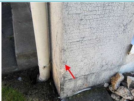
Matériaux : ZPSO-001 Prélèvement : P001 Description : Enduit extérieur (ITE) Localisation : Bat 49 - Facade Résultat : Absence d'amiante